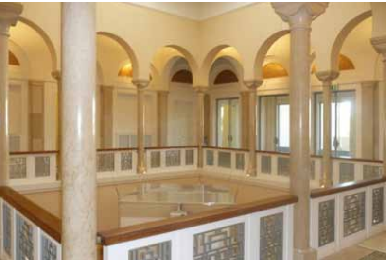
TRIPOLI MUSEUM OF LIBYA